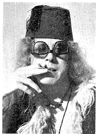
Den københavnske svindler, som i dag til middag blev rullet i tjære og fjer.

Enhver oplysning bedes givet til landbetjent Madsen, der vil være at træffe på kroens bor-gerstue fra kl. 11 til 17.